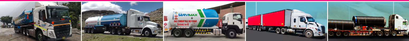
TRANSPORTE DE MINERALES

Llevamos más de 20 años operando en rutas de alta complejidad con los mas altos estándares operativos, seguridad y calidad. Además, cuenta con la certificación de TRINORMA con BUREAU VERITAS (9001, 14001 Y 45001)